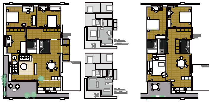
Das Stützenraster im Erdgeschoss bietet mit grossen Abständen Flexibilität in der Grundrissorganisation. Die Wohnungen in den Obergeschossen zeigen schlüssige Raumabfolgen.