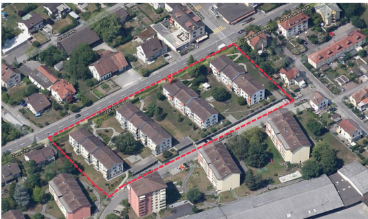
Bestand: links BG Svea und rechts BWG Graphis